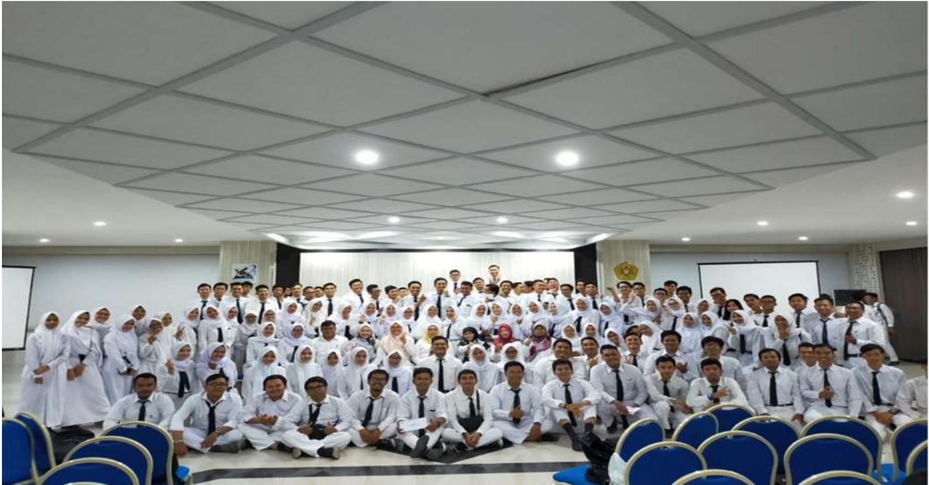
YUDISIUM SARJANA STRATA 1 (S-1) PERIODE III GASAL 2019-2020 . TERDIRI DARI PRODI TEKNIK KIMIA 15, PRODI TEKNIK INDUSTRI 34 ,PRODI TEKNOLOGI PANGAN 30, PRODI TEKNIK SIPIL 38 DAN PRODI TEKNIK LINGKUNGAN 14