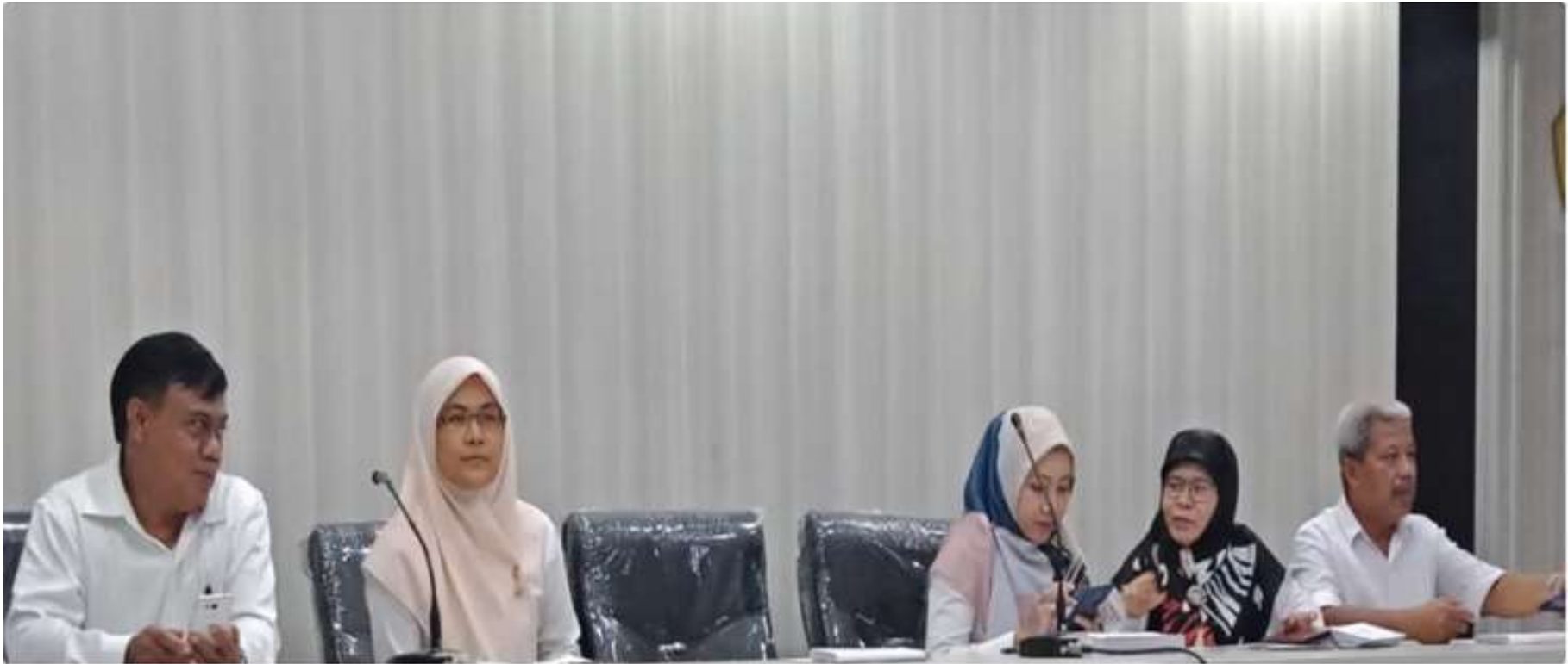
YUDISIUM SARJANA STRATA 1 PERIODE III TAHUN AJARAN 2019-2020